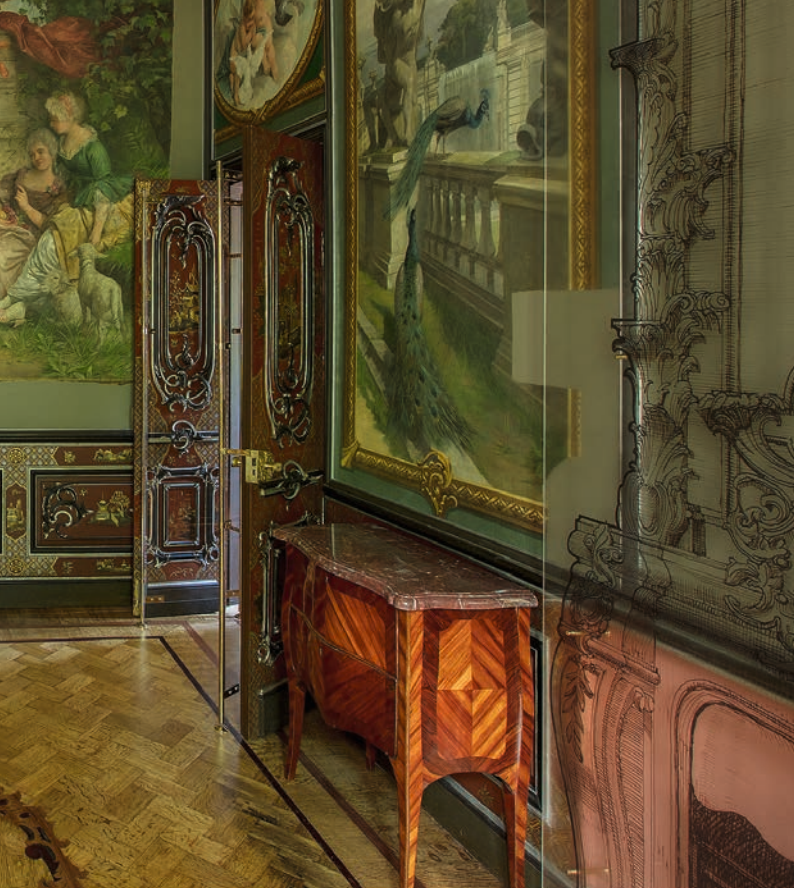
Спальня. Общий вид

и дверь с декоративной росписью. В это время во дворце помещалась медицинская санитарная часть 3-й тяжелой гаубичной артиллерийской бригады. К счастью, никто из людей тогда не пострадал. После войны камин в Спальне не восстанавливался. Разбитая створка двери и панели были бережно отреставрированы в 1950-х годах. Благодаря искусству реставраторов сегодня вы не увидите и следов от отверстий в потолке, образовавшихся вследствие разрыва снаряда. Лепной декор перекрытия, возобновленный в 1880-х годах, в основном сохранился хорошо. В композиции, составленной из пяти круглых медальонов, использован так называемый